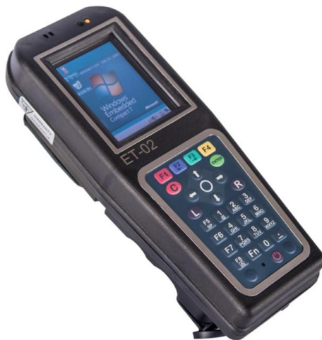
Widok terminala mobilnego typu ET-02/M/B